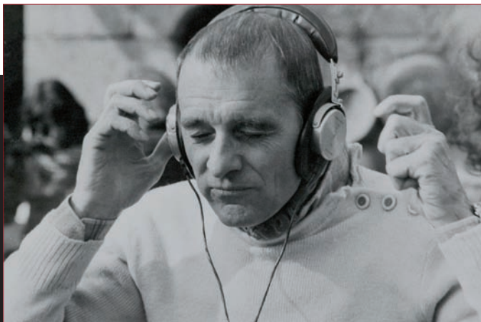
René Allio en 1975

René Allio, qui avait fondé en 1979 un éphémère Centre Méditerranéen de Création Cinématographique, sut donner corps à ses utopies architecturales et politiques. L'objectif de ce colloque, résolument pluridisciplinaire, est d'explorer les différentes facettes de cette œuvre exigeante, foisonnante et engagée.